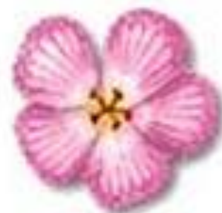
اجزای گل ۴ یا ۵ تایی یا مضرب آنها