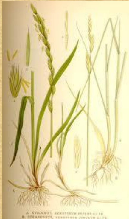
ساقه ی علفی و نازک