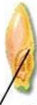
دانه: یک لپه ای