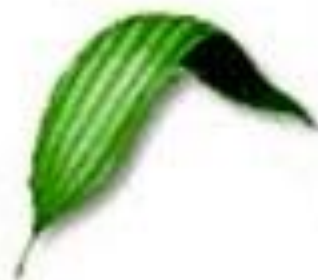
رگبرگ های موازی