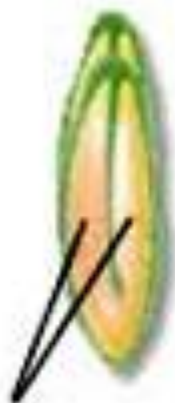
دانه: دولپه ای