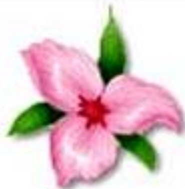
اجزای گل سه تایی یا مضرب ۳