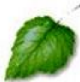
رگبرگ های منشعب